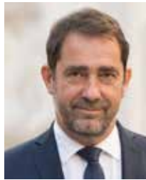
Christophe Castaner Ministre de l'Intérieur

Par nature, le ministère de l'Intérieur est celui de l'urgence, des crises, de l'instant. L'intensité de l'année 2019 l'a amplement démontré, parfois de manière dramatique. Mais nous voulons qu'il soit aussi un ministère qui regarde au loin, pour et avec les Français. C'est l'objet du Livre blanc de la sécurité intérieure. C'est le but de cette conférence des citoyens.