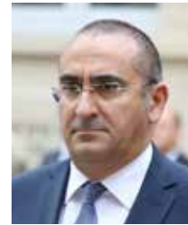
Laurent Nuñez Secrétaire d'État auprès du ministre de l'Intérieur